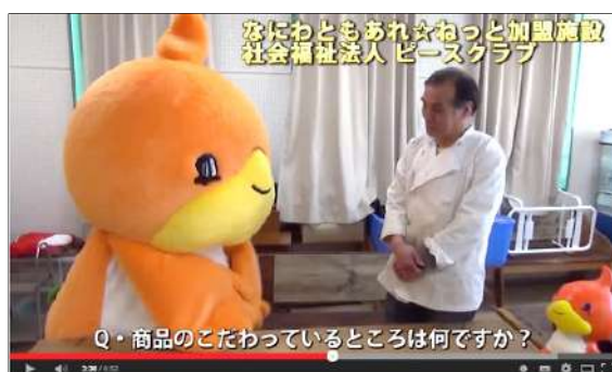
取材動画ではともちゅんがインタビューをしています。

ともちゅんレポーターが施設や職場に出向き、施設内を案内してもらったり、職員の方にインタビューをすることで、施設の様子や働いているところを動画として紹介しています。レポートを実施したところには、ともちゅん認定シールをプレゼントし、ともちゅんHPで紹介動画が見れるようになります。今年制作した紹介動画は2本。動画はともちゅんHPの『ともちゅん認定シール』のページから見るすることができます。