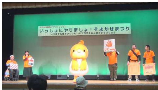
そよかぜまつりにはせふいろとも参加しました。出し物として「ともちゅんジャンケン」をしました。